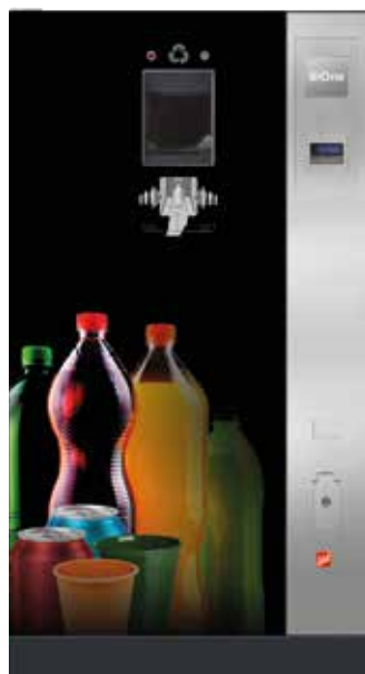
SiOne (Beispiel Design A „Color Explosion“ – Flaschen/ Dosen/Becher bunt )