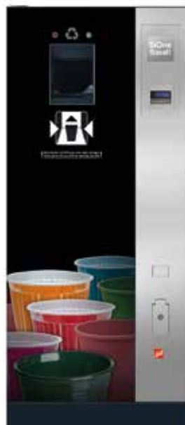
SiOne Small (Beispiel Design B „Color Explosion“ – Becher bunt)