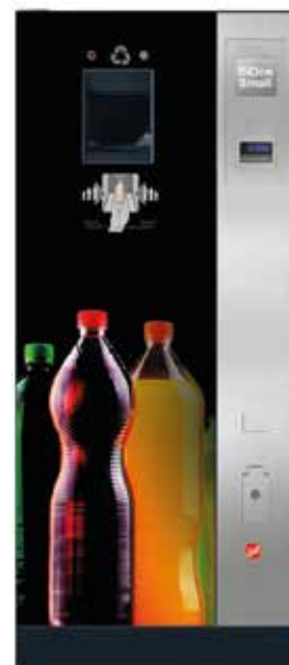
SiOne Small (Beispiel Design C „Color Explosion“ – Flaschen bunt)