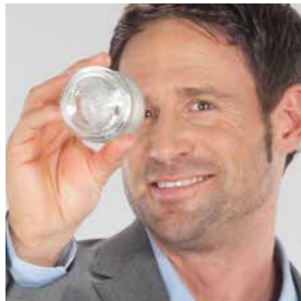
Einfache und sichere Annahme durch Einlegen des Leergutes